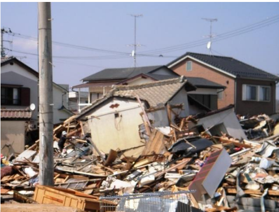
■住宅地には依然として残る倒壊家屋（福島・いわき）