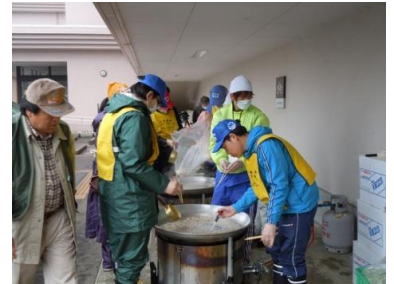
避難所での炊き出し（郡山）

気候が暖かくなってきているため、屋内作業ではTシャツと作業着の動きやすい服装、また体育館での作業もあるため、スニーカーや上履きの持参が望ましいです。