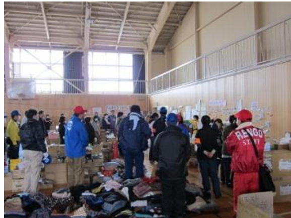
■一般のボランティアと共同で作業（福島・会津若松）