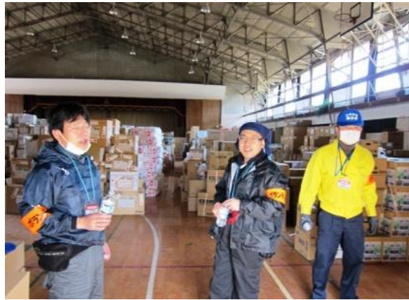
■ちょっと一息。おつかれさまです。（福島・会津若松）