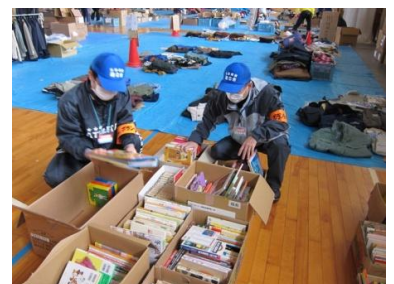
物資の仕分け作業（会津若松）

※4/11 午後5時過ぎに福島県浜通りを震源とする強い地震がありました。連合ボランティアの皆さん全員の無事が確認されています。