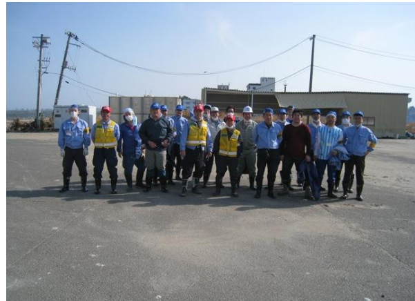
■一日の作業を終えて撮影。傾いた電柱とたわんだ電線が津波の爪痕を示している（福島・相馬）