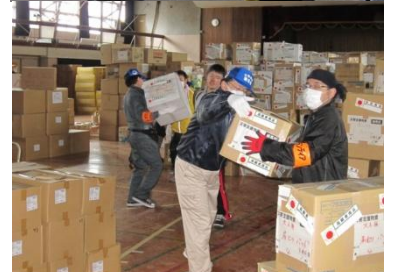
トラック一杯の物資を体育館に運び込む（会津若松）