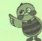
埼玉県マスコット「さいたまっち」

URL http://www.pref.saitama.lg.jp/a0808/rodoseminar/index.html