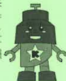
川口市マスコット 「きゅぼらん」