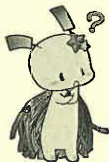
狭山市 セタの妖精 おりひい