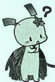
狭山市 セタの妖精 おりひい

県の労働相談センターには賃金についての相談が多く寄せられています。賃金は労働者にとって重要な生活の糧であるため、労働者はもちろんのこと、使用者においても、トラブルを未然に防ぐために関係する法令についての知識を身につけることが求められます。 本セミナーでは、賃金・退職金をテーマに、働く方、雇う方に知っていただきたい基礎知識を詳しく解説します。