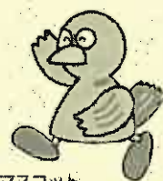
埼玉県のマスコット 「コバトン」