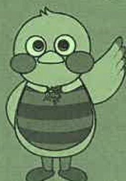
埼玉県のマスコット「さいたまっちゃん」

本セミナーでは、安心して働くため・雇うために必要な有期労働契約の知識について、実際のトラブル事例とともに、労働契約の基本からわかりやすく学びます。